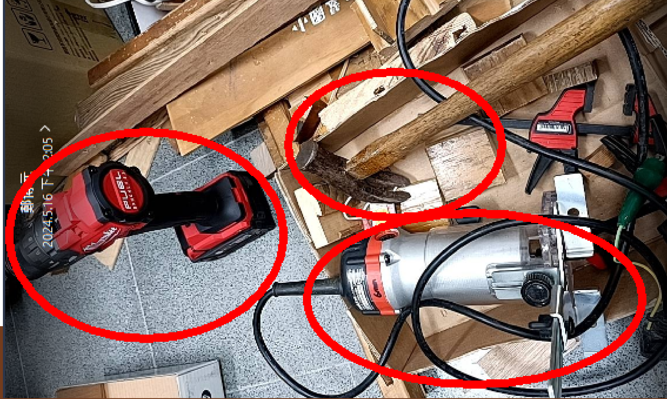
弟弟妹妹們：電鑽機 鐵鎚 修邊機 ...