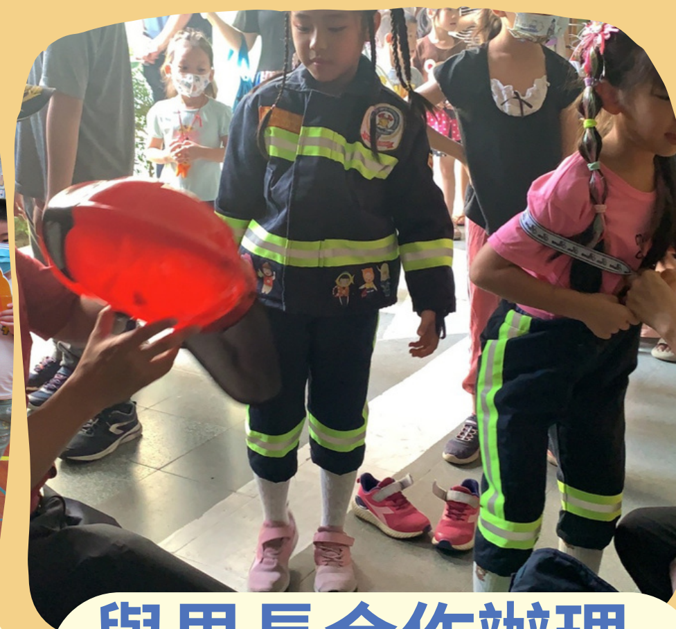
與里長合作辦理 防災體驗營