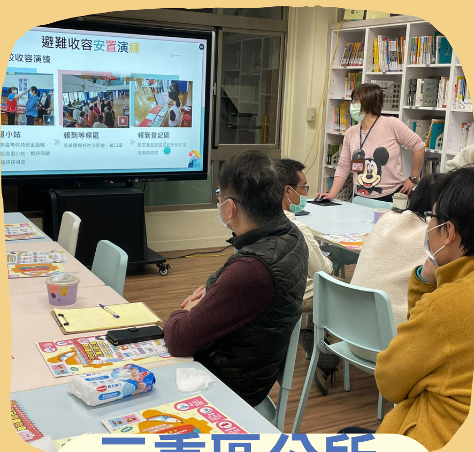
三重區公所 防災實務研習