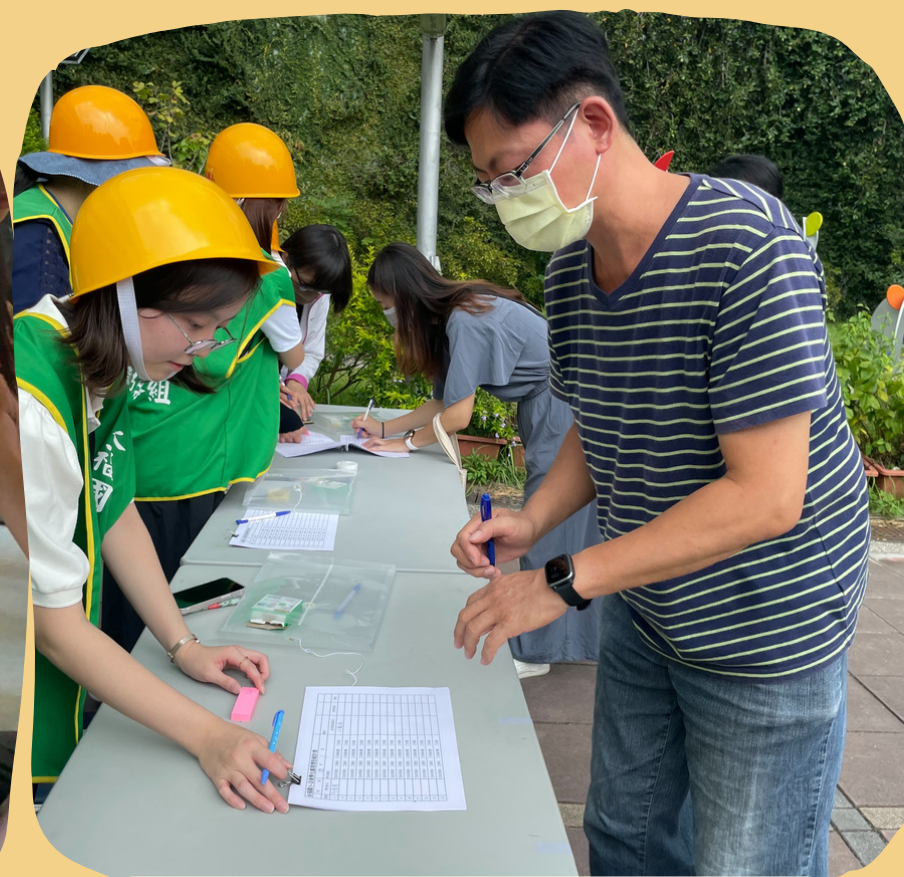
邀請家長 參與防災演練