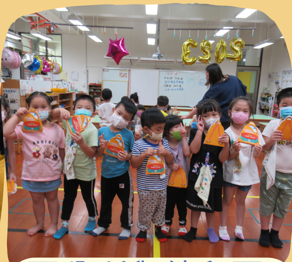
區公所與幼兒園 -防災避難袋製作