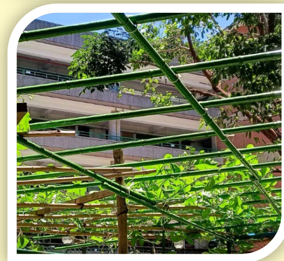
志工媽媽協助的有機蔬菜區。