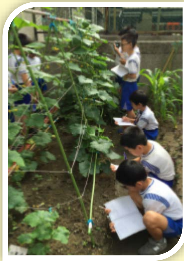
學生有機耕作種小黃瓜。