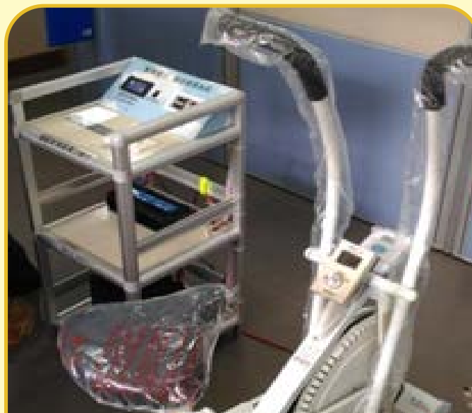
發電腳踏車購置與 環境佈置