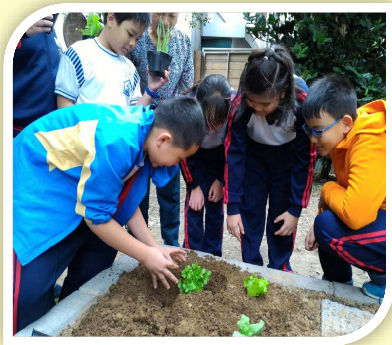
學生學習有機耕作，種植芹菜。